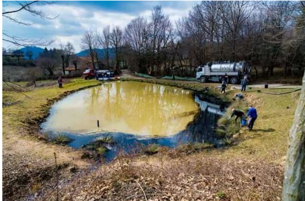
2018. Oli esausti nella pozza Meder in Comune di Serle (BS) Monumento Naturale Altopiano di Cariadeghe

Situazioni che richiedano un intervento urgente per la conservazione delle popolazioni anfibie