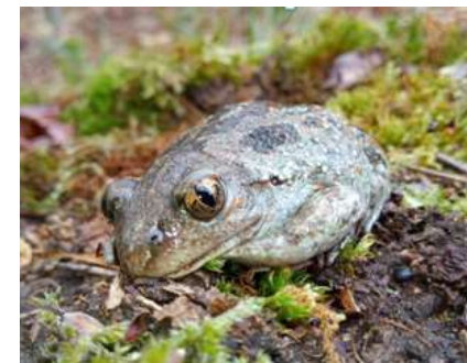
Pelobates fuscus insubricus

Salvataggio anfibi in Lombardia - Stato dell'arte ed esperienze a confronto