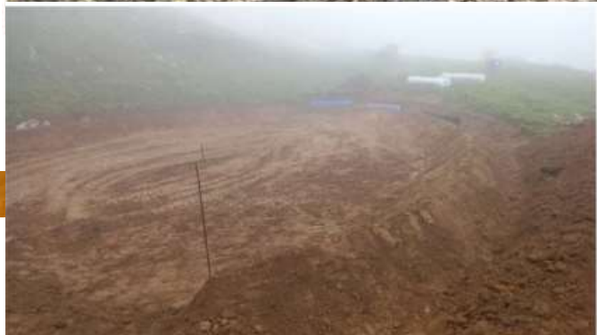
Pozza 1 - lavori in corso