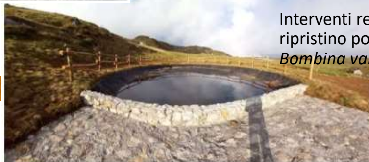
Pozza 1 - Lavoro finito

Interventi realizzati a Taleggio (BG) di ripristino pozze d'alpeggio a favore di Bombina variegata