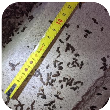
Foto generale dell'accumulo di guano

→ Invia le foto all'indirizzo mail dello Sportello pipistrelli ( pipistrelli@valpredina.eu ) comunicando l'indirizzo del sito di ritrovamento del guano, qualche nota sul contesto(es. data dello scatto) e, se vuoi, il consenso ad essere inserito nella mailing list dei «Custodi di colonia» per ricevere la newsletter di progetto.