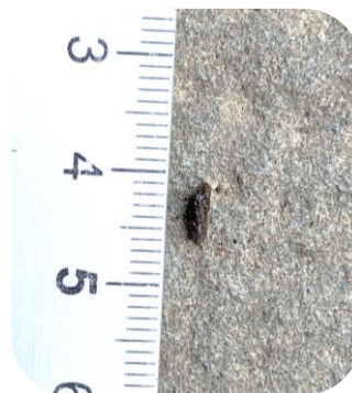
Foto del singolo pellet di guano, con riferimento dimensionale