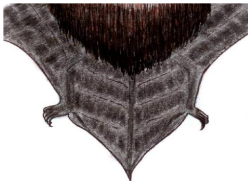
Foto dell'uropatagio con dettaglio della coda e del piede.

Foto generale del capo frontale e/o laterale con dettaglio dell'orecchio in cui sia ben visibile il trago.