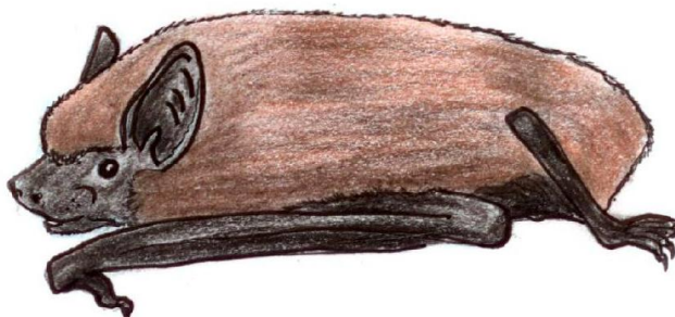
Foto generale dell'esemplare vista laterale e/o dorsale.

Esempio di inquadrature per foto scattabili durante le operazioni di rilascio e verifica della condizione dell'esemplare catturato accidentalmente durante le attività di monitoraggio ornitologico.